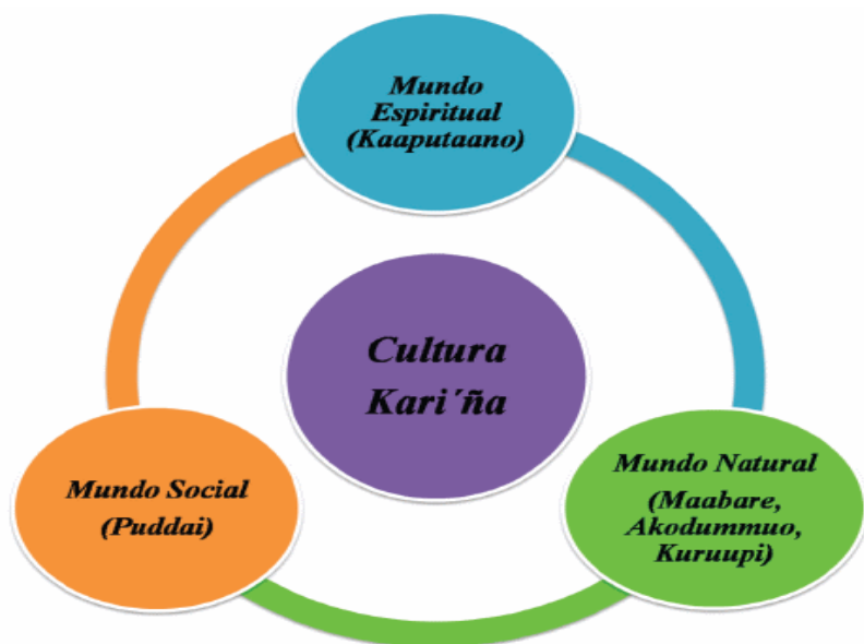
Figura 3. Representación gráfica de los tres grandes mundos de la etnia Kari'ña.

Los pueblos indígenas son los protectores de la naturaleza. La necesitan para vivir y, en consecuencia, la cuidan como parte de ellos. Conocen sus plantas, su fauna, sus alimentos... todo, excepto el modo de hacerles daño. Pese a ello, muchos pueblos indígenas están perseguidos y son expulsados de sus tierras, las mismas que han habitado durante años. En este artículo se recogen varios de sus modos de actuar. Así viven en la tierra, así la cuidan, así se convierten en sus guardianes. Los pueblos indígenas y tribales cuidan de sus entornos mejor que nadie", ya que "han dependido de ellos y los han gestionado durante miles de años". Por ello apuesta por su protección. Las poblaciones indígenas son imprescindibles para la naturaleza. Un ejemplo de este planteamiento son los pueblos indígenas kari'ña que habitan en el estado Anzoátegui. El pueblo Kari'ña es descendiente directo del pueblo Caribe, que luchó desde el mismo momento en que se inicia la invasión a nuestro territorio, con conocimiento del mundo natural, espiritual y social en materias tales como: astronomía, medicina, caza, pesca, recolección y sólida convivencia con la naturaleza (Amodio, 1991; Ministerio del Poder Popular Para la Educación, 2008).