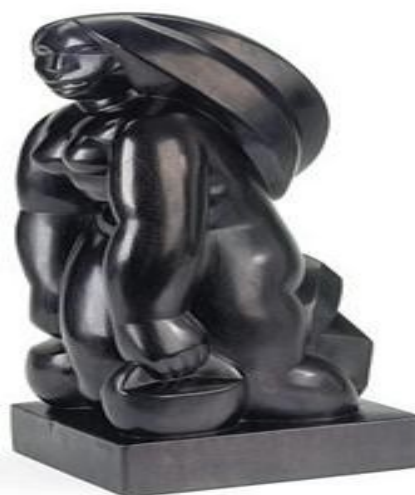
Autor: Francisco Narváez

Si quieres profundizar en los diferentes temas de educación media técnica y en la modalidad de especial y adulto, así como todos los niveles y modalidades, visita la página web del Ministerio del Poder Popular para la Educación www.me.gob.ve y accede al enlace del programa "Cada familia una escuela" o directamente a través de cadafamiliaunaescuela.me.gob.ve