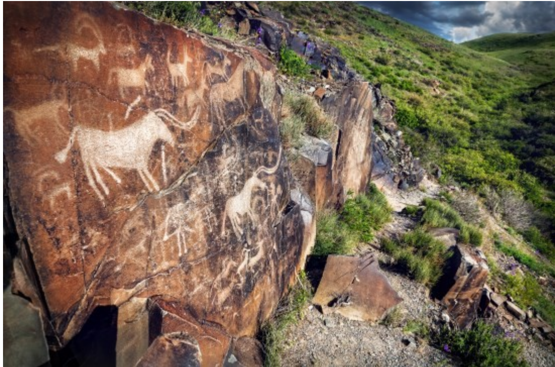
El arte rupestre es un tipo de expresión artística de la época prehispanica

En Venezuela, muchos historiadores indican que el poblamiento de nuestras tierras se produjo por migraciones humanas que se asentaron hace aproximadamente 15.000 años. Hubo cinco oleadas migratorias hacia Venezuela, los arahuacos hace unos 4.000 años aproximadamente, vinieron desde el sur de América y se establecieron en muchas partes país. Posteriormente, ingresaron los timotes y los cuicas hacia los Andes venezolanos. Finalmente, los caribes se asentaron en las costas orientales y centrales de Venezuela y formaron comunidades agrícolas.